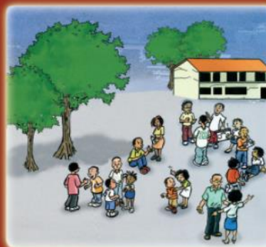
suivre les consignes, écouter la radio et attendre les secours