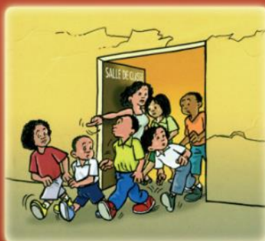
après la secousse, évacuer le bâtiment sans panique