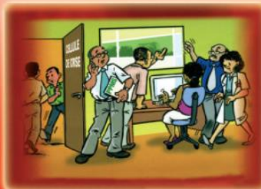
Le Plan Particulier de Mise en Sécurité prévoit l'organisation d'une cellule de crise