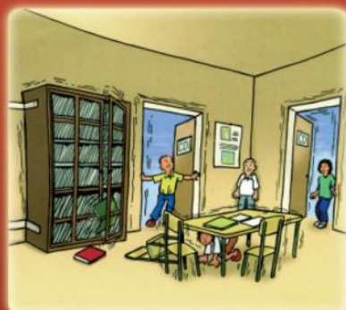
se protéger dans un coin de mur ou dans l'encadrement d'une porte