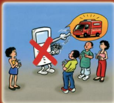
ne pas téléphoner, laisser les lignes libres pour les secours