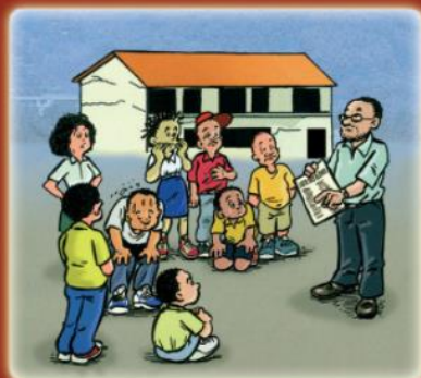
en zone de regroupement, les adultes font l'appel