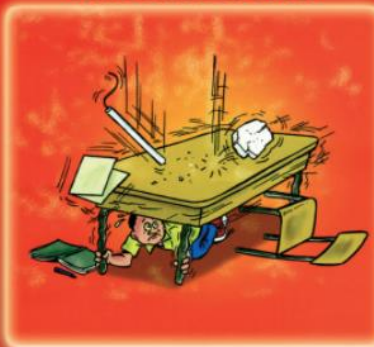
tenir les pieds de la table si elle bouge