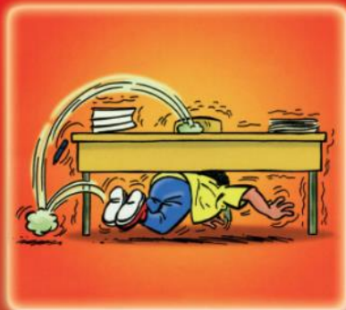
dès la 1 re secousse, se réfugier sous une table